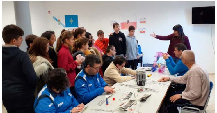
REPORTEROS DEL LORCA

La visita fue totalmente positiva, el alumnado de primero vieron a un grupo de personas, que aunque tengan dificultades para realizar alguna actividad, son PERSONAS.