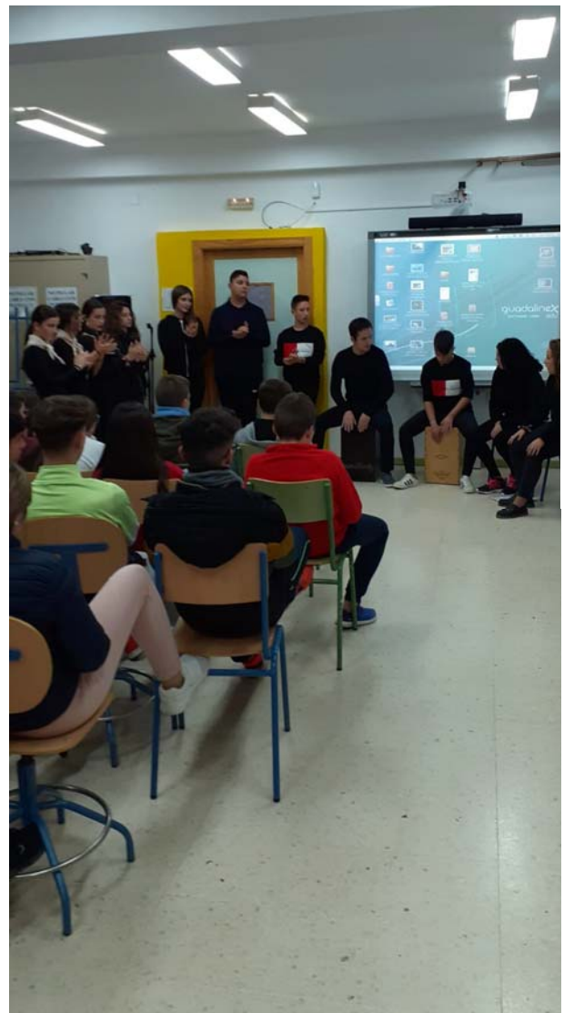
REPORTEROS DEL LORCA