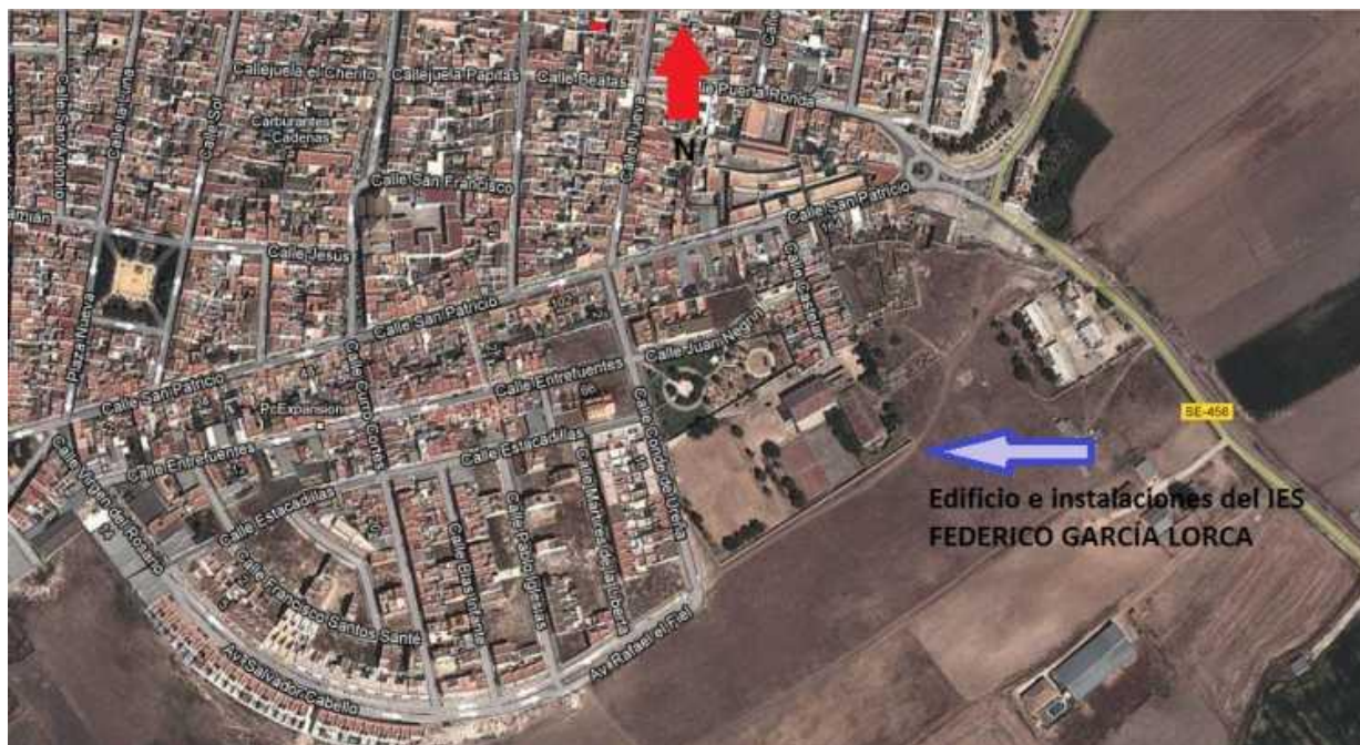
Imagen tomada de Google maps sobre localización general del Centro.

El Instituto de Educación Secundaria Federico García Lorca se encuentra localizado al SE de la localidad en una zona de entrada a la localidad, coincide con una zona de cierta marginalidad del Pueblo aunque también es cierto que en los últimos años ha crecido relativamente el núcleo urbano hacia esa zona con la promoción de viviendas de nueva construcción.