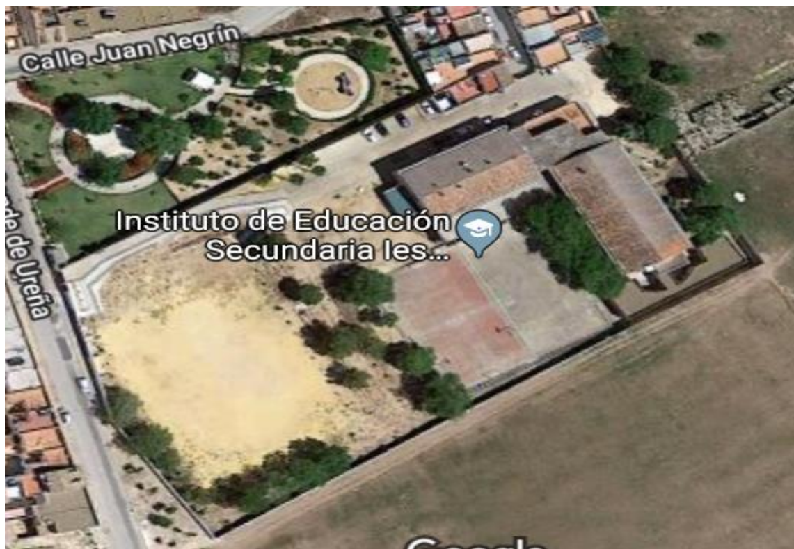
Imagen de Google maps con detalle de planta del edificio.

El edificio posee las siguientes dependencias: